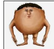
資料1 200万年後の人類の姿 をこのように考える専門家もいる