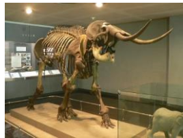
← 資料2 ナウマンゾウの化石 横須賀自然・人文博物館