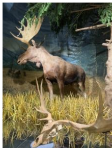
資料3→ オオツノジカの化石 ヘラジカのはく製 相模原市博物館